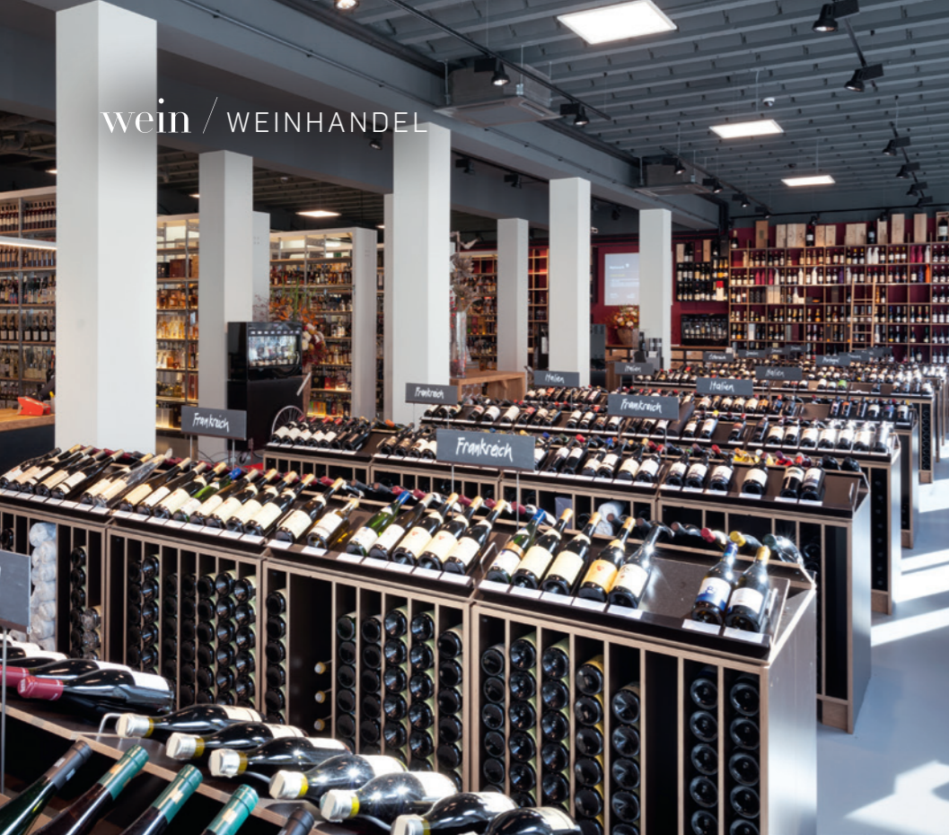
Die Paul Ullrich AG führt mehrere Ladengeschäfte. Während des Lockdowns waren diese zwar geöffnet, wurden aber kaum besucht.