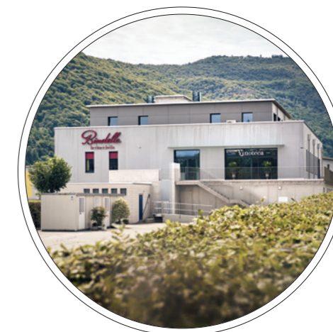
Der Weinhandel von Familie Bindella gehört zu den besten der ganzen Schweiz.

95 – 100 Punkte 85 – 89 Punkte 90 – 94 Punkte 80 – 84 Punkte